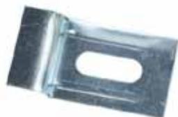
05 - Wandaufhänger (2x)