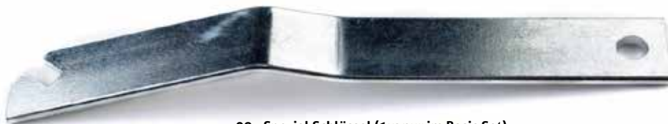
09 - Spezial Schlüssel (1x; nur im Basis Set)